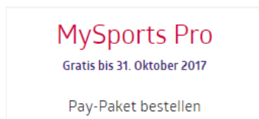
Tabelle13: Hinweis des Verrechnungszeitpunktes von MySports Pro - Cockpit

Bei Kunden mit einem MIA-Flag kann aus technischen Gründen die nicht Verrechnung vor Launch nicht berücksichtigt werden. Aus diesem Grund, können alle MIA-Flag-Kunden das MySports Pro erst ab Launch bestellen.