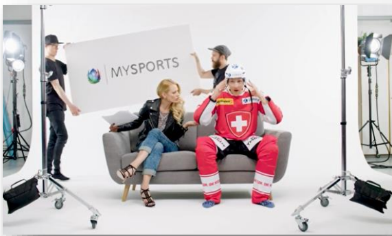
TV-Sport XL-Deal mit Tag-On MySports

Geplante Werbemittel mit MySports (Entwürfe!)